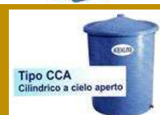
Tipo CCA Cilindrico a cielo aperto