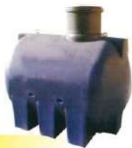
SINT SERBATOI INTERRABILI