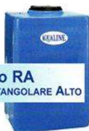
Tipo RA RETTANGOLARE ALTO