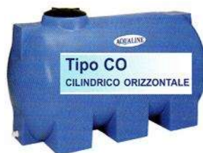
Tipo CO CILINDRICO ORIZZONTALE