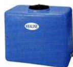
Tipo RM RETTANGOLARE MEDIO