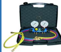
KIT VALIGETTA CON GRUPPO MANOMETRICO A 4 VIE - R22-134-404-407