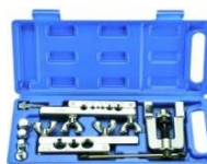
Kit completo flangiatiubi 6-8-10-12-14-16-19 mm