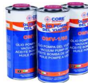
OLIO MINERALE PER POMPE VUOTO - LT. 1 - 32 CST DI VISCOSITÀ - PER RC2-D