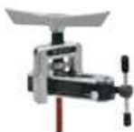
Cartellatrice universale Expo