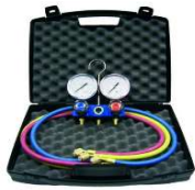
KIT VALIGETTA CON GRUPPO MANOMETRICO GM-2-S2-C1-80-PF-KIT-V - R32/410