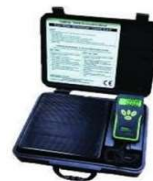
BE100/5 - KG. 100 - RISOLUZIONE 5 GRAMMI CON VALIGIA