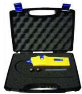
SEEKER - Cercafughe elettronico