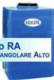
Tipo RA RETTANGOLARE ALTO