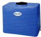
Tipo RM RETTANGOLARE MEDIO