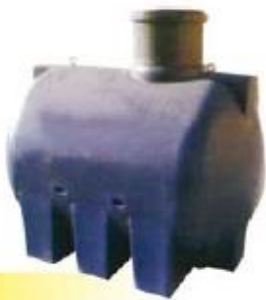
SINT SERBATOI INTERRABILI