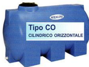
Tipo CO CILINDRICO ORIZZONTALE