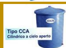
Tipo CCA Cilindrico a cielo aperto