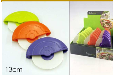
TAGLIAPIA TONDO 3 ASSORTITI "ZZ"