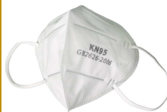
MASCHERINA MONOUSO FFP2 "ZC"