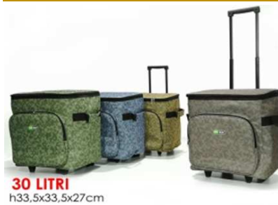
TROLLEY TERMICO 30 LT 4 ASS. "ZZ"