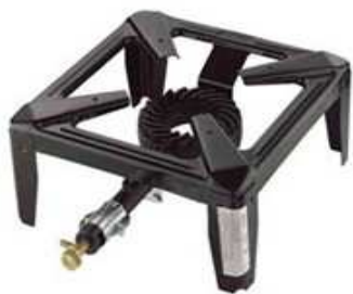
FORNELLONE CM 40X40X19 CON BRUCIATORE IN GHISA KW 8,5 OMOLOGATO CE "ZZ"