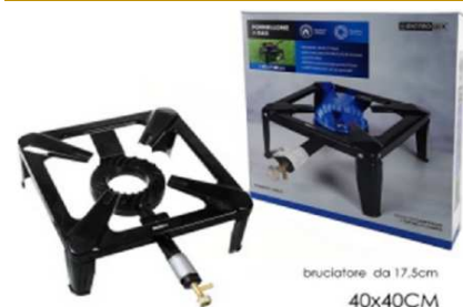
FORNELLONE GRANDE "ZZ"