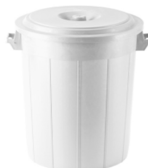
Bidone lt 70 ø cm 45x60h 17,7"x23,6"h 25085 NEUT - Neutro 8003507250857 70 lt 18,5 gal 1