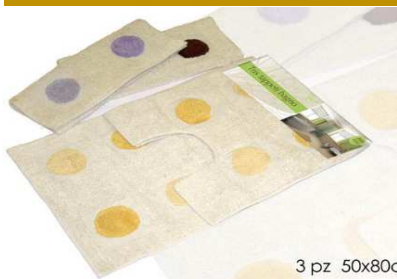
Set 3 tappeti tavolo 4 ass. "ZZ"