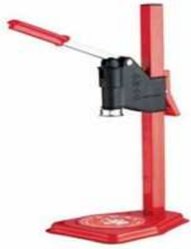
TAPPATRICE A 1 LEVA "ORNELLA" "ZZ"

Codice 110ORNELLA Listino € 21,76 Più Rae