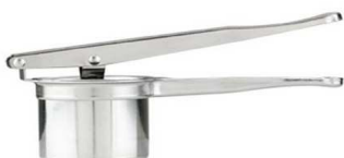
SCHIACCIAPATATE INOX QUICK "ZZ"