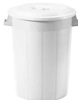
Bidone lt 120 ø cm 52x76h 20,5"x29,9"h 25135 NEUT - Neutro 8003507251359 120 lt 31,7 gal 1