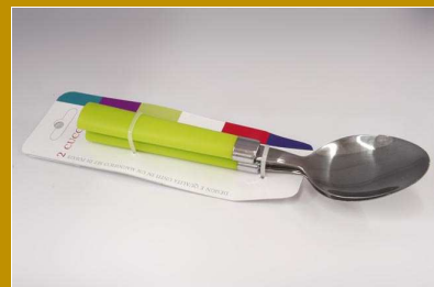
SET 2 CUCCHIAI VERDE FLUO "ZZ"