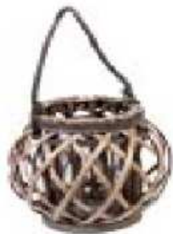
P/CANDELA LANTERNA RATTAN NAT.CM. 22X21 "ZZ"