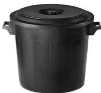
Bidone lt 50 ø cm 45x44h 17,7"x17,3"h 25060 NE02 - Nero 8003507250604 50 lt 13,2 gal 1