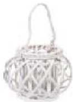
P/CANDELA LANTERNA RATTAN B.CO CM. 22X21 "ZZ"