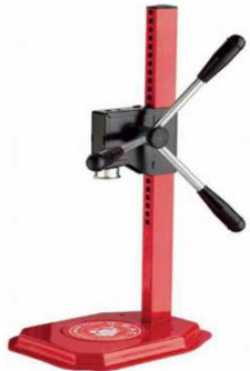
TAPPATRICE A 3 LEVE "REGINA" "ZZ"

Codice 130ETERNA Listino € 12,16 Più Rae