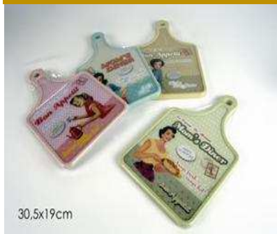
TAGLIERE QUADRATO C/MANICO "ZZ"