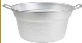
CALDAIA SPECIAL CM 26 MANIGLIE ALLUMINIO "ZZ"

Caldiaia Special con maniglie in alluminio