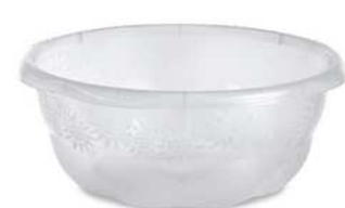
Ciotola "Fiorella" ø cm 26x11h 10,2"x4,3"h 76026 TRA - Trasparente 8003507760264 24 14 x 3 1008 h cm 105