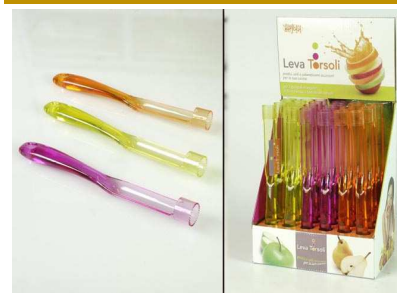
LEVA TORSOLI 3ASS.IN DISPLAY "ZZ"