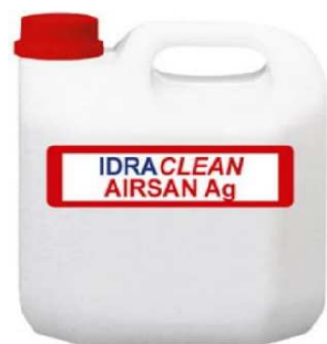
IDRACLEAN AIRSAN AG DA 5 KG Pulizia e sanificazione impianti aria condizionata 5 lt "ZC"