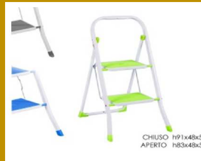
SCALETTA RICHIUDIBILE 2 SCALINI 3 ASS. "ZZ"