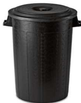
Bidone lt 120 ø cm 52x76h 20,5"x29,9"h 25130 NE02 - Nero 8003507251304 120 lt 31,7 gal 1