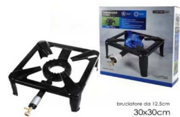
FORNELLONE PICCOLO "ZZ"