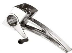
GRATTUGGIA MANUALE INOX " LA GRATTUGGIA" "ZZ"