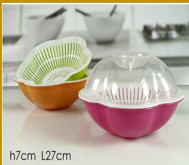
SET CONTENITORI FIORI 3PZ "ZZ"