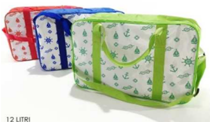
BORSA TERMICA 12LT DEC. ANCORA 3ASS"ZZ"