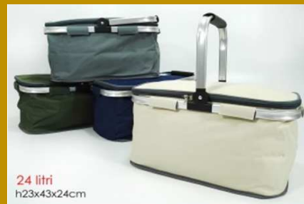
BORSA TERMICA PICNIC 24 LT 4 ASS"ZZ"