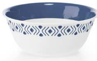
Ciotola Tosca Ø 23 cm Ø cm 23x10h 9,05"x3,9"h 55051 BC01/BL26 - Bianco/Palace blue 8003507550513 12 15x4 720 h cm 105