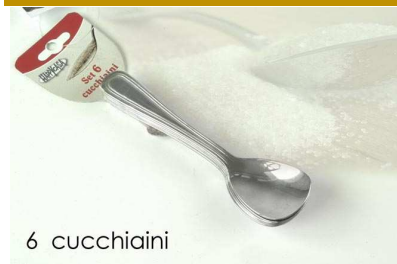
SET 6 CUCCHIAINI CUR. GELATO "ZZ"