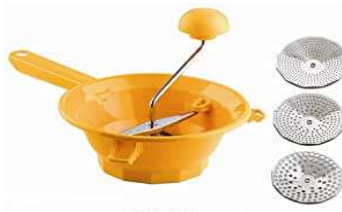
PASSATUTTO IN PLASTICA TILLY 3 DIAM. 24 "ZZ"