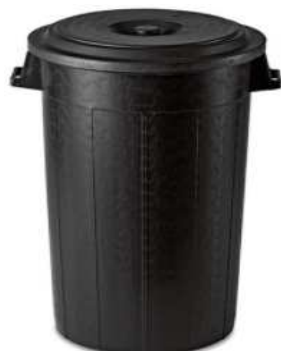
Bidone lt 100 ø cm 52x65h 20,5"x25,6"h 25110 NE02 - Nero 8003507251106 100 lt 26,4 gal 1