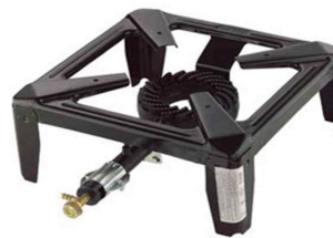
FORNELLONE CM 30X30X13 CON BRUCIATORE IN GHISA KW 3,5 OMOLOGATO CE "ZZ"

Codice 220REGINA Listino € 34,99 Più Rae