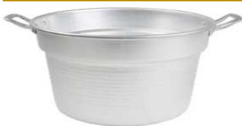
CALDAIA SPECIAL CM 30 MANIGLIE ALLUMINIO "ZZ"

Caldiaia Special con maniglie in alluminio