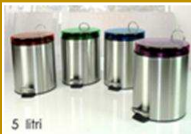
BIDONE IMMONDIZIA 5L C/ACC. "ZZ"