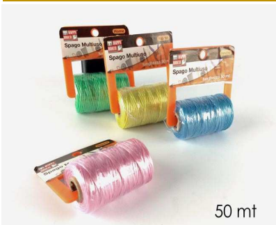
SPAGO 50 MT 4 ASS. "ZZ"