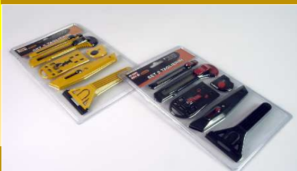
SET 6 TAGLIERINI 2 ASS. "ZZ"