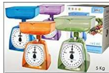
BILANCIA CUCINA 5 KG. "ZZ"