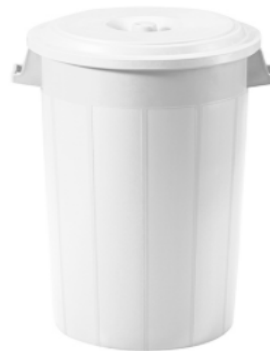
Bidone lt 100 ø cm 52x65h 20,5"x25,6"h 25115 NEUT - Neutro 8003507251151 100 lt 26,4 gal 1