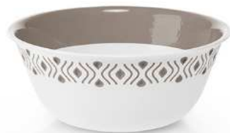
Ciotola Tosca Ø 29 cm Ø cm 29x13h 11,4"x5,1"h 55100 BC01/GR27 - Bianco/Tortora chiaro 8003507551008 8 8x4 +4x3 352 h cm 104