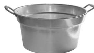
CALDAIA POMODORI CM 70 MANIGLIE ALLUMINIO "ZZ"

Caldiaia pomodori con maniglie in alluminio