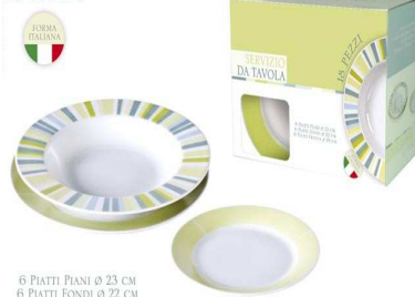
BOX 18 PEI DEC RAGGI VERDI "ZZ"

6 PIATTI PIANI Ø 23 CM 6 PIATTI FONDI Ø 22 CM 6 PIATTI FRUTTA Ø 19 CM