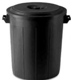
Bidone lt 70 ø cm 45x60h 17,7"x23,6"h 25080 NE02 - Nero 8003507250802 70 lt 18,5 gal 1