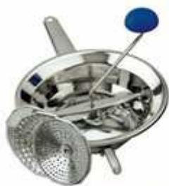
PASSATUTTO INOX EMANUEL 3 DIAM. 20 "ZZ"