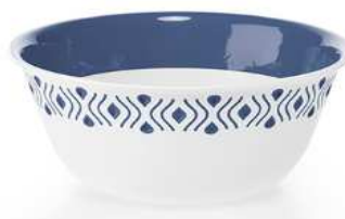
Ciotola Tosca Ø 19 cm Ø cm 19x9h 7,5"x3,5"h 55002 BC01/BL26 - Bianco/Palace blue 8003507550025 12 24x5 1440 h cm 120