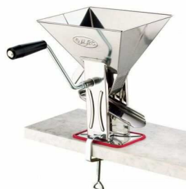
SPREMI POMODORO "GULLIVER" "ZZ"