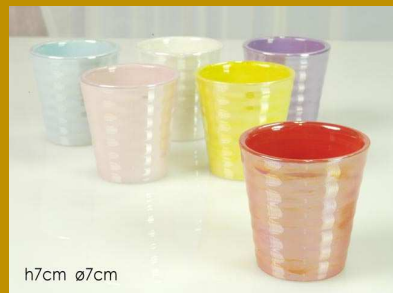
VASETTO 6 PZ ASSORTITO "ZZ"