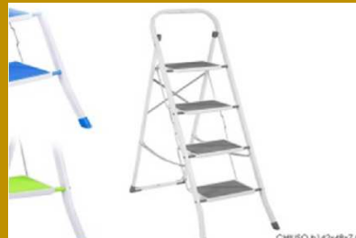
SCALETTA RICHIUDIBILE 4 SCALINI 3 ASS "ZZ"

CHIUSO h142x48x7 CM APERTO h126,5x47,5x97 CM