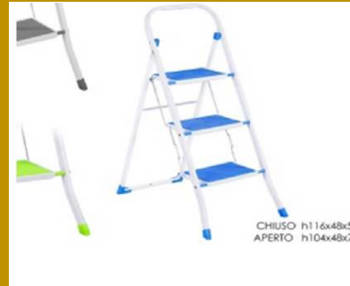
SCALETTA RICHIUDIBILE 3 SCALINI 3 ASS "ZZ"

CHIUSO h116x48x5 CM APERTO h104x48x75 CM