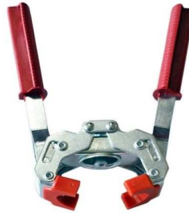
TAPPATRICE A 2 LEVE "ETERNA" "ZZ"

Codice 110ORNELLA Listino € 21,76 Più Rae