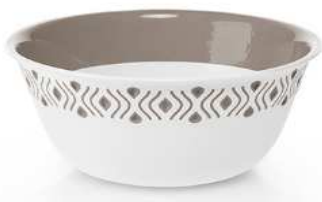
Ciotola Tosca Ø 23 cm Ø cm 23x10h 9,05"x3,9"h 55050 BC01/GR27 - Bianco/Tortora chiaro 8003507550506 12 15x4 720 h cm 105