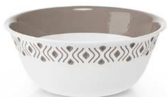
Ciotola Tosca Ø 19 cm Ø cm 19x9h 7,5"x3,5"h 55001 BC01/GR27 - Bianco/Tortora chiaro 8003507550018 12 24x5 1440 h cm 120