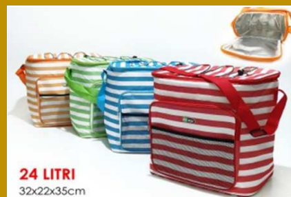
BORSA TERMICA ALLUMINIO 24LT RIGHE 4ASS"ZZ"