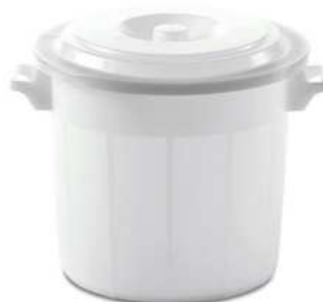
Bidone lt 50 ø cm 45x44h 17,7"x17,3"h 25065 NEUT - Neutro 8003507250659 50 lt 13,2 gal 1