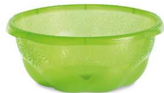
Ciotola "Fiorella" ø cm 30x13h 11,8"x5,1"h 76032 VD44 - Verde Fluorescente 8003507760325 24 11 x 2 528 h cm 105