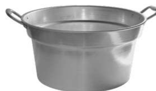
CALDAIA POMODORI CM 64 MANIGLIE ALLUMINIO "ZZ"

Caldiaia pomodori con maniglie in alluminio