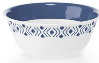
Ciotola Tosca Ø 29 cm Ø cm 29x13h 11,4"x5,1"h 55101 BC01/BL26 - Bianco/Palace blue 8003507551015 8 8x4 +4x3 352 h cm 104