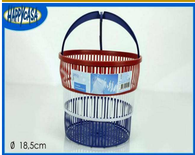
CESTINO PORTAMOLLETTE "ZZ"