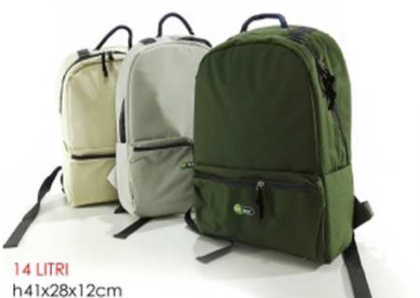
ZAINO TERMICO 14 LT 3ASS"ZZ"