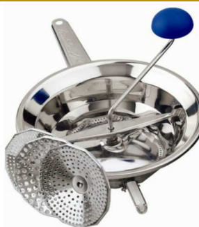
PASSATUTTO INOX EMANUEL 3 DIAM. 24 "ZZ"